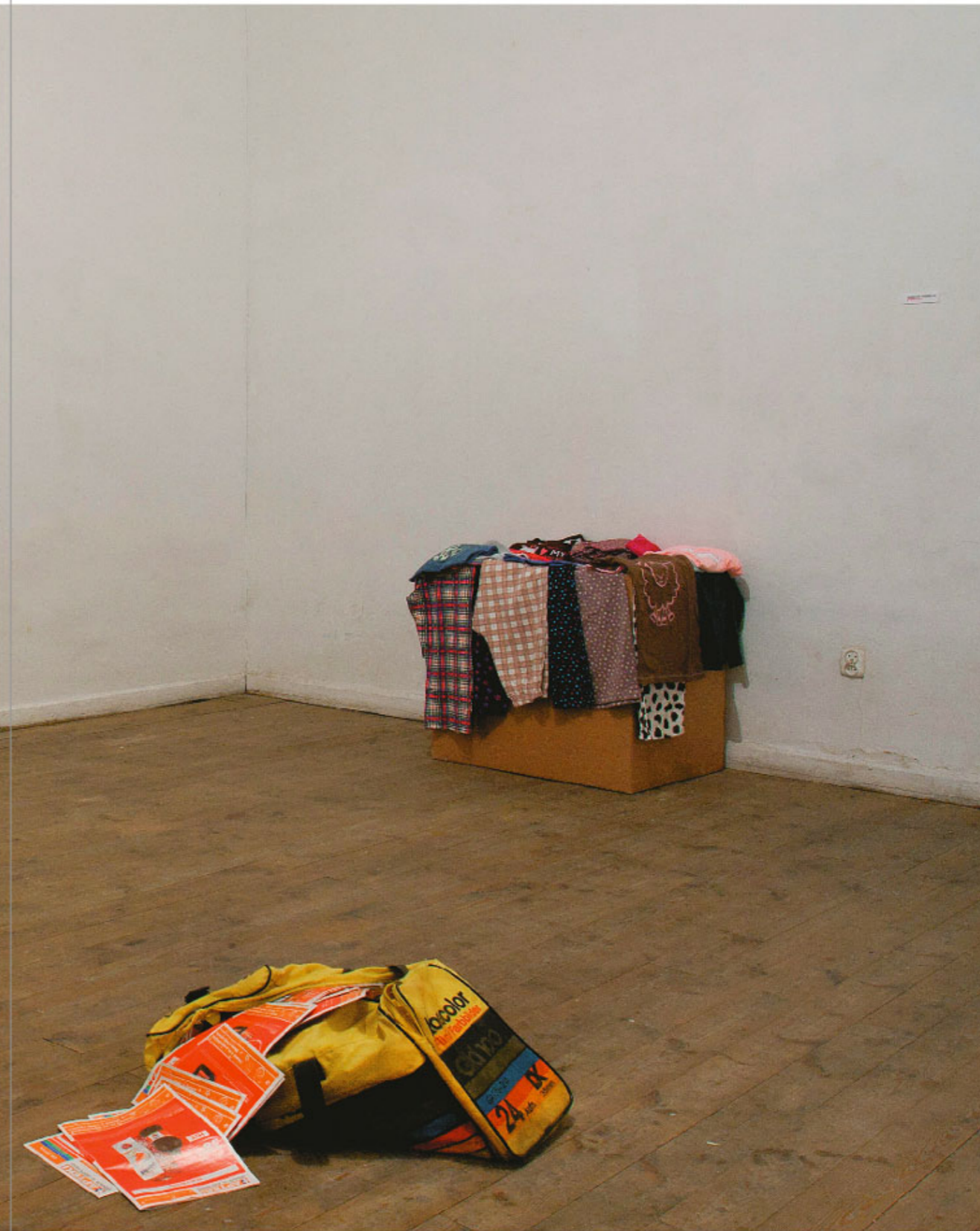
Wystawa Zawód artysty , Galeria Wschodnia, Łódź, 2011