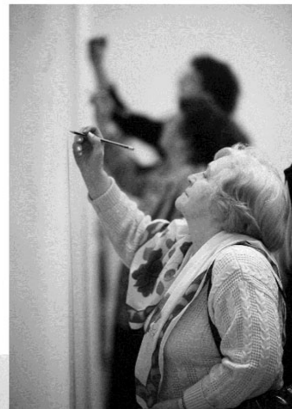
Wernisaż projektu ms 3 . Re:akcja Muzeum Sztuki w Łodzi, 2009

W ramach ms 3 Re:akcja współpracowali z Muzeum Sztuki: Andrzej Chętko, Jerzy Grzegorski, Adam Klimczak, Tomasz Komorowski, Niewidzialne Miasto, Łukasz Ogórek, Marcin Polak, Marta Skłodowska, Grupa Pewnych Osób, massmix.