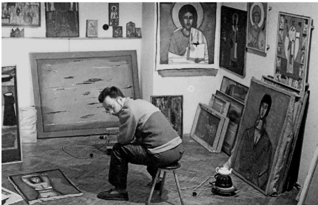
W pracowni, ul. Zachodnia, Łódź, początek 1958, dzięki uprzejmości Archiwum Galerii Starmach In his studio, Zachodnia Street, Łódź, early 1958, courtesy of Starmach Gallery Archive