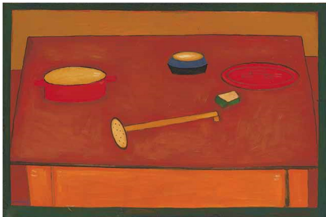
Martwa natura , 1957, olej, płótno, 67 × 101 cm Muzeum Sztuki w Łodzi, nr inw.: MS/SN/M/264 © Muzeum Sztuki, Łódź Still Life , 1957, oil, canvas, 67 × 101 cm Muzeum Sztuki, Łódź, Inv. No.: MS/SN/M/264 © Muzeum Sztuki, Łódź