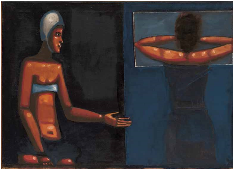
Dwie dziewczyny z lustrem , 1958, olej, płótno, 73,5 × 102,5 cm Muzeum Sztuki w Łodzi, nr inw.: MS/SN/M/643 © Muzeum Sztuki, Łódź Two Girls with a Mirror , 1958, oil, canvas, 73,5 × 102,5 cm Muzeum Sztuki, Łódź, Inv. No.: MS/SN/M/643 © Muzeum Sztuki, Łódź