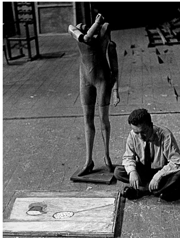
Z pracami, ok. 1958 With his artworks, ca. 1958