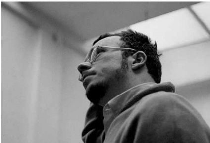
W pracowni, ul. Zachodnia, Łódź, 1958 In his studio, Zachodnia Street, Łódź, 1958