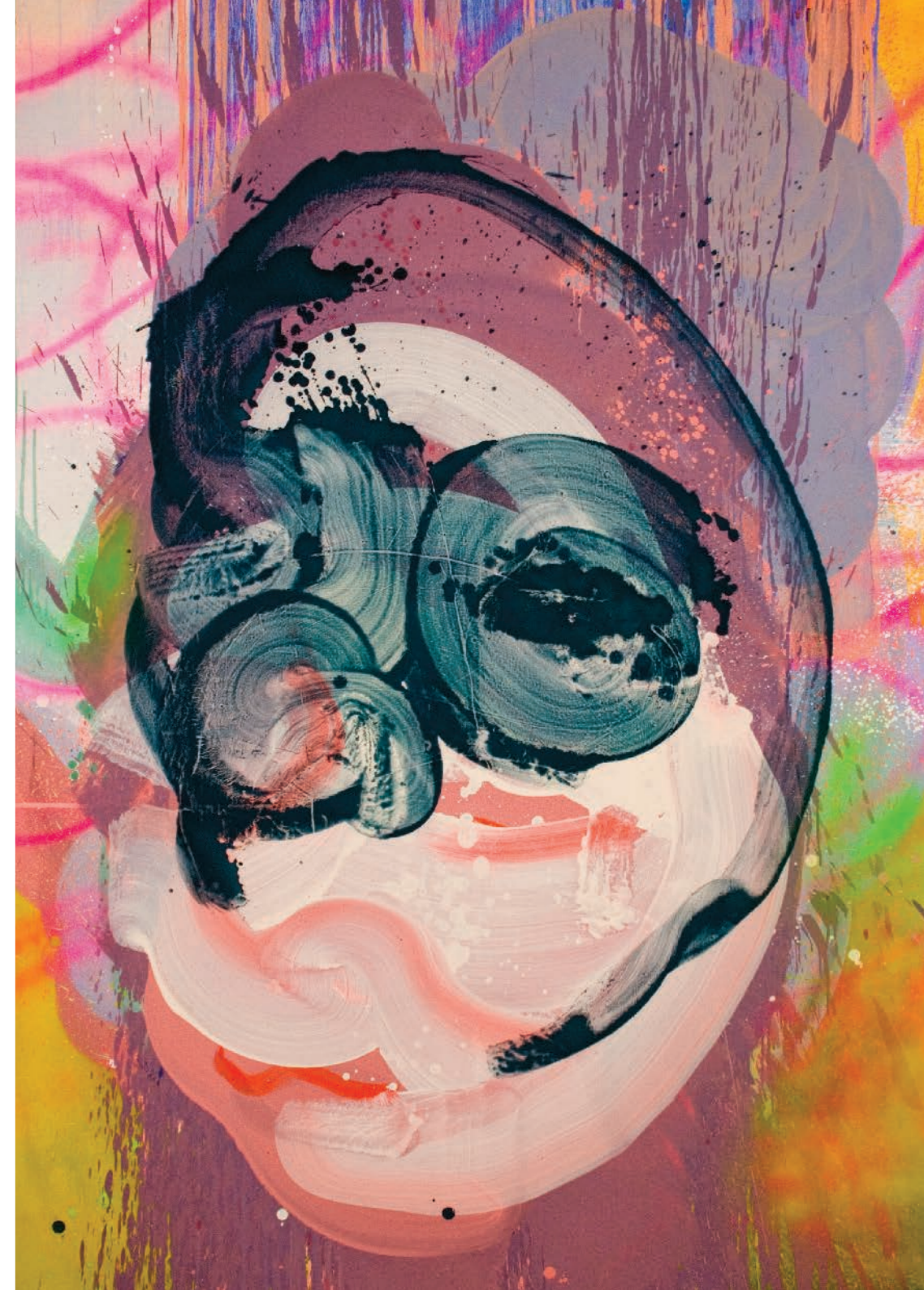
Maciej Olekszy Głowa dziecka / Child's Head 2023 olej, płótno / oil, canvas