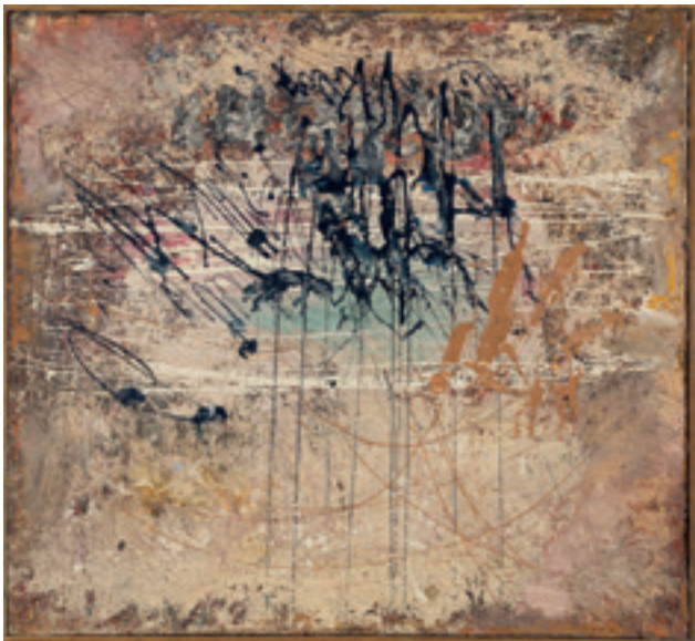
Hommage à Simone Martini, 1957

olej, nitro, płótno, 73 x 81,5 cm kolekcja autora