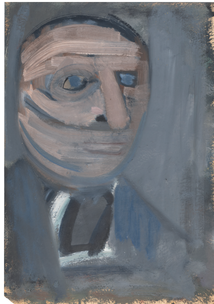
Artur Nacht-Samborski Głowa męska na szarym tle

po 1968 olej, karton, 50 × 35 cm Muzeum Sztuki w Łodzi © Spadkobiercy Artura Nachta-Samborskiego i Muzeum Sztuki, Łódź