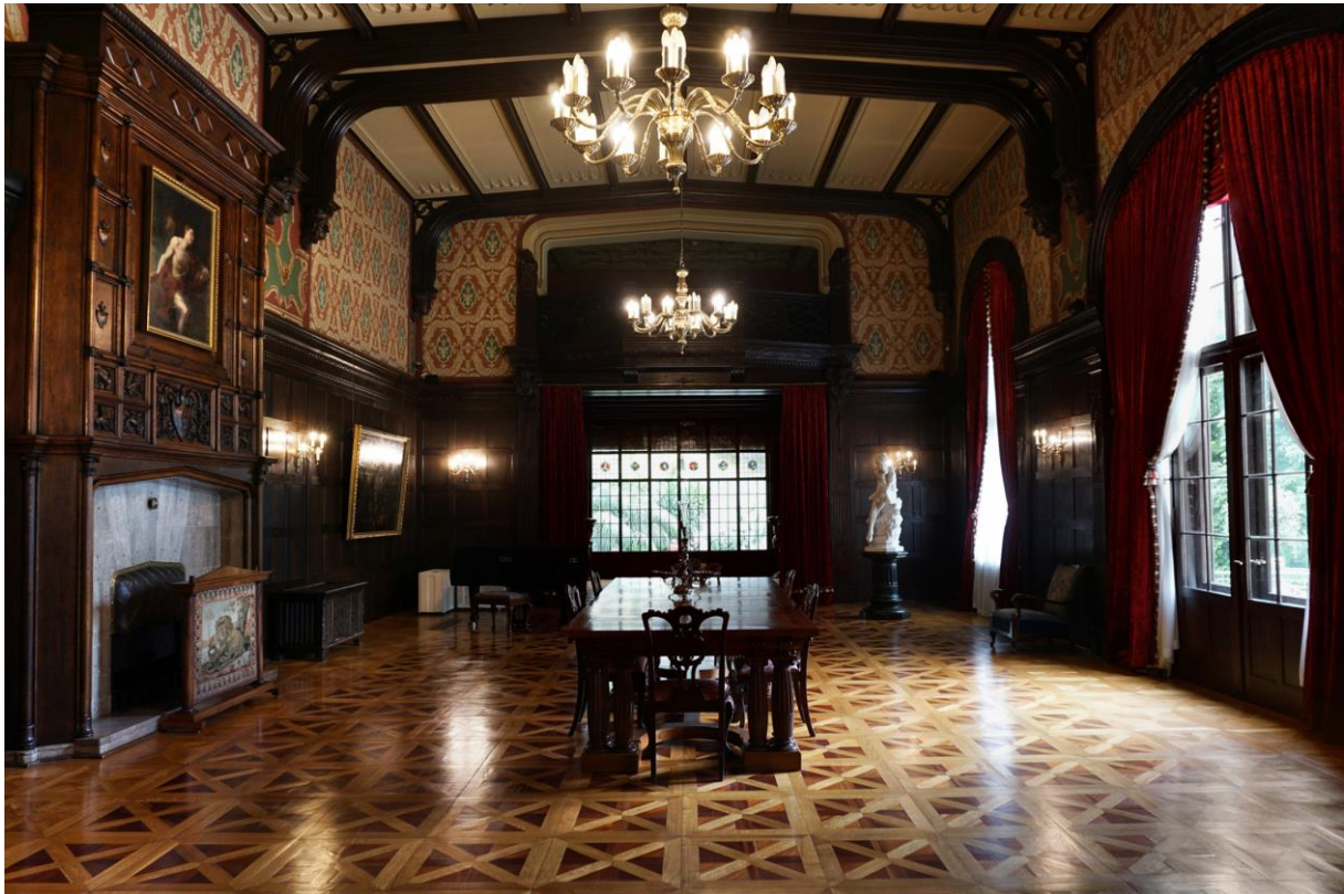
Duża Sala, Płac Herbsta