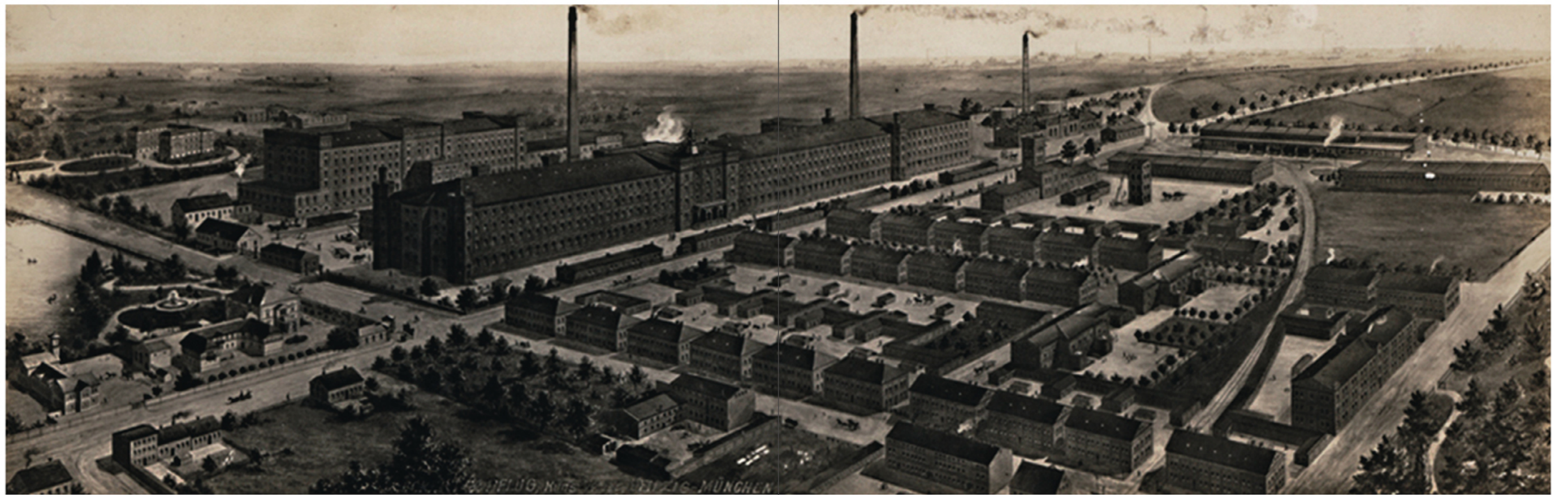
03-04 / Karl Scheibler-Werke, zweite Hälfte des XIX Jhd.